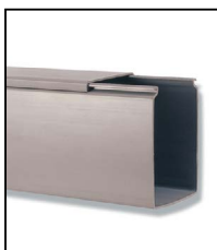
Modelo F Fechado