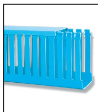
Modelo P Aberto