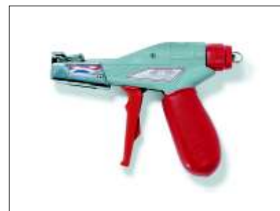
MK9 SST Ferramenta exclusiva para aplicações de Abraçadeiras em Aço Inox