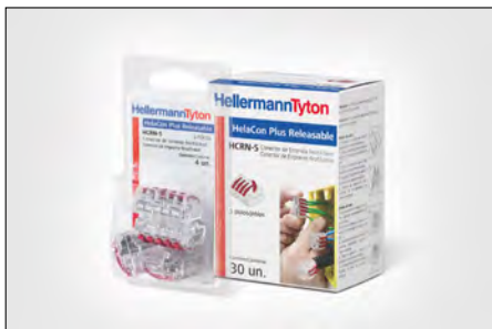
HelaCon Plus Reutilizável.